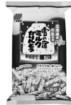
90g 雪の宿 ミルクかりんとう