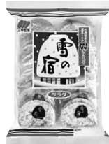
24枚 雪の宿 サラダ