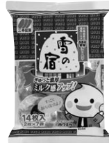
14枚 雪の宿 サラダ